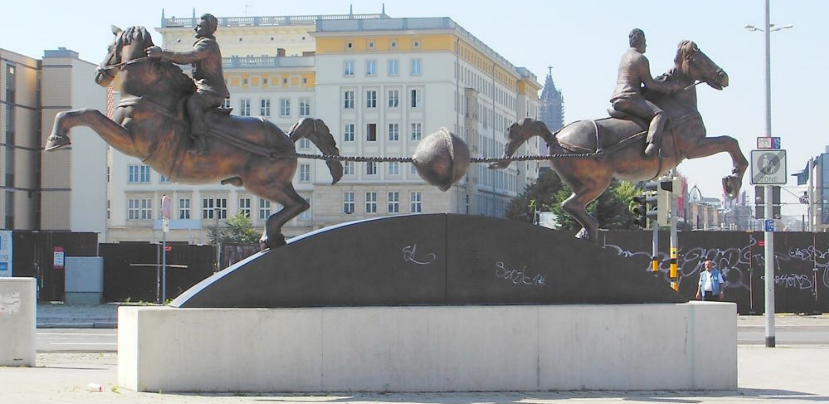
Otto von Guericke 1654